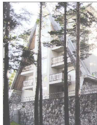
График заездов в ЭУНК КБГУ (Приэльбрусье, п. Эльбрус)

Лучше гор могут быть только горы! Приэльбрусье - жемчужина нашей республики, один из уникальнейших природных курортов, размещенных на территории Российской Федерации. Необыкновенная красота Приэльбрусья во все времена манила к себе людей со всего мира. Чистейший горный воздух, суровые заснеженные вершины, великолепные водопады, а также подаренные Землей целебные источники, - все это оказывает оздоровительное воздействие на всякого, кому посчастливилось здесь оказаться.