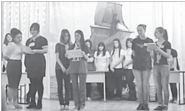
фото знаменитостей», они заработали дополнительные баллы любимым командам.

шая лига» (4 К гр.). На конкурс были представлены следующие задания: разминка «Жизненный и профессиональный кодекс педагога»; конкурс капитанов; домашнее задание «Мы – артисты»; конкурсы «Если бы...», «Гвоздь программы», «Пойми меня», «Скалолазы», «Памятник». Каждая группа показала умение работать коллективно, творчески, проявляя профессиональное остроумие. Увлекательно, нестандартно выполнили конкурсанты домашнее задание, где были инсценированы детские сказки в жанре комедии, трагедии, драмы. Особый интерес у зрителей вызвала сказка «Теремок», подготовленная командой «Высшая лига» в стиле трагикомедии. Герои сказки озвучили актуальные проблемы Евросоюза и России. Запись выступления можно было направить президенту США Обаме, и это был бы действенный политический шаг. В конкурс были вовлечены и болельщики. Выиграв в заданиях «Что бы это значило?», «Детские