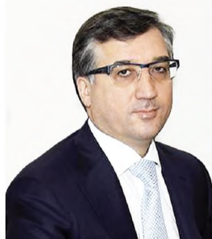
Алий МУСУКОВ, Председатель Правительства Кабардино-Балкарской Республики

В 1993 году окончил учетно-экономический и математический факультеты Кабардино-Балкарского государственного университета.