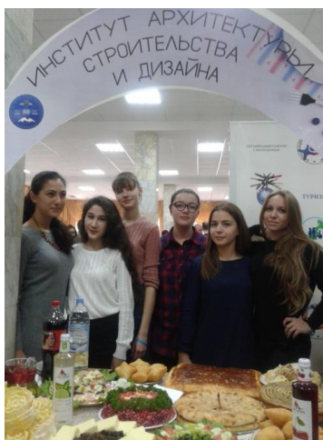
Студенты на выставке национальных блюд

В рамках празднования знаменательной даты в КБГУ состоялись торжественные мероприятия, в которых студенты института архитектуры, строительства и дизайна приняли самое активное участие. Среди торжественных мероприятий - фольклорно-этнографический праздник «Национальные мотивы» с выставкой национальных блюд.