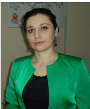
Мурзаканова М.М. «Разработка новых эффективных антиоксидантов для полимерных материалов»