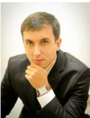
Машуков Х.В. «Разработка автоматизированной системы управления совокупным кредитным риском коммерческого банка»