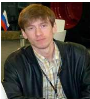
Уртаев Т. «Модернизация пропашных культиваторов для обработки почв засоренных камнями»