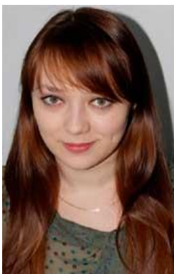
Айшаева З. «Разработка системы генетических маркеров устойчивости зерновых культур к