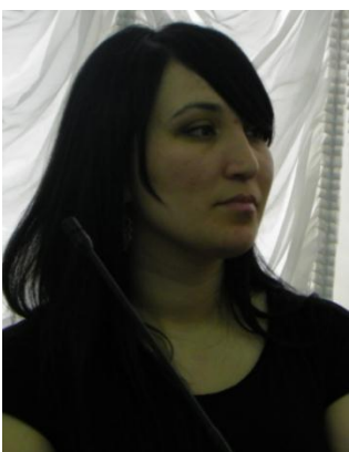
Уянаева М.М. «Разработка тонкопленочного высокочувствительного нанотранзистора»