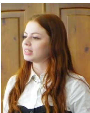
Унежева Т.А. «Автоматизированная система электронного документооборота медицинского учреждения».