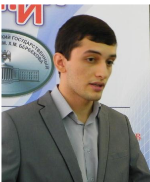
Кармов А.Б. «Разработка программного продукта для доступа к информации лиц с нарушениями зрения»