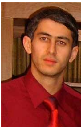
Ксалов А.М. «Разработка электронных кабардино-русско-кабардинского и балкаро-русско- балкарского словарей для компьютера для сотового телефона».