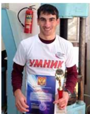
Эфендиев Р.З. «Малозатратная технология производства легкодоступных сухих растворных смесей на базе местного сырья»