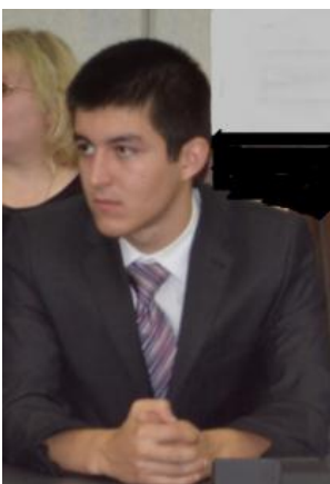
Гедгафов А.Ю. «Автомобиль с гибридной установкой»