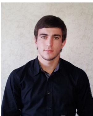
Шамурзаев А.Х. «Разработка автоматизированной системы долгосрочного планирования кредитного портфеля банка»