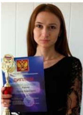
Карова Л.Б. «Разработка агентного подхода к имитационному моделированию процесса распространения гепатита В в КБР»