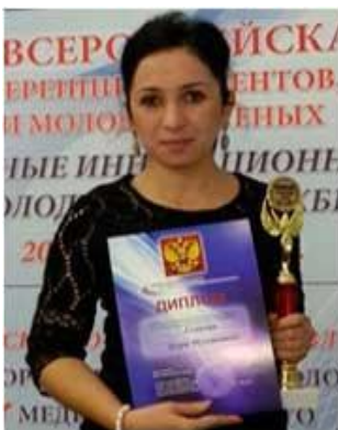
Гемуева З.Х. «Разработка натурального биологического продукта Цераса Bioactive на основе Galleria melonella »