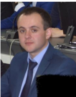
Узденов Р.А. «Разработка инкубатора для выведения личинок насекомых»