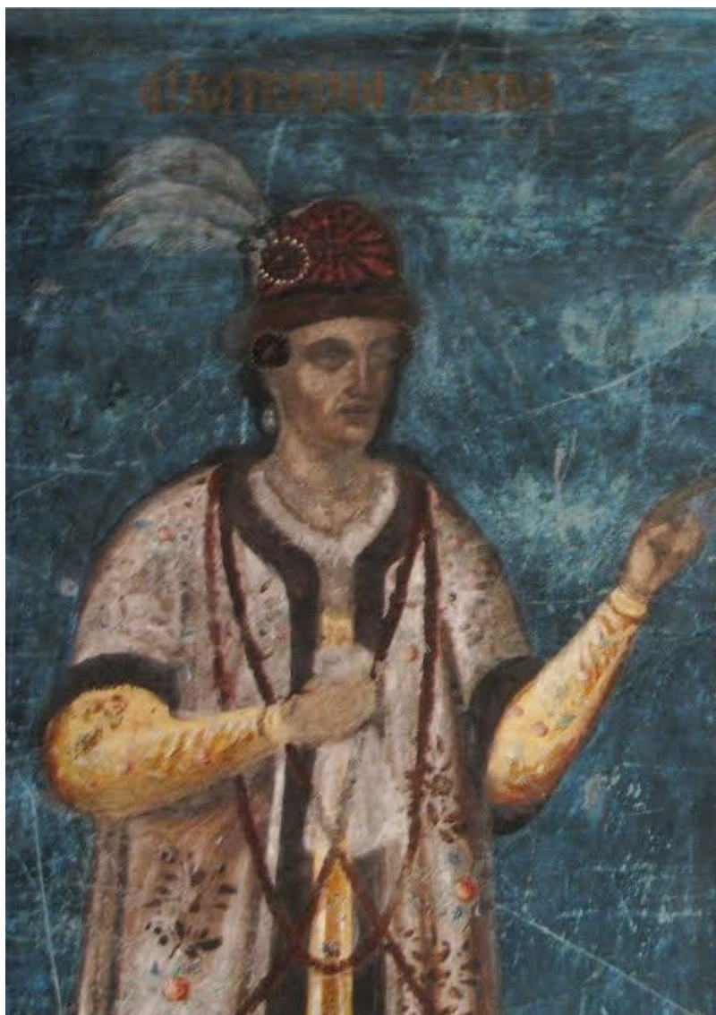
Рис. 4. Екатерина. Монастырь Голия. Яссы, Румыния.

Не менее интересные и содержательные свидетельства, сохранившиеся в источниках о Екатерине, повествуют о ней как о приверженице и защитнице христианства. Евлия Челеби (1611-1684) писал, что Екатерина покровительствовала и сделала много пожертвований монастырю Голия.