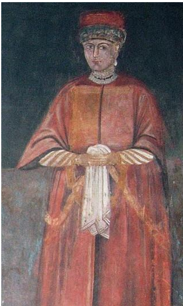
Рис. 1. Екатерина. Церковь Господжи (часовня) в резиденции Господарского Дворца. Яссы, Румыния 1 .

Молдавское княжество в середине XVII века находилось в поле пересечения межгосударственных и геополитических интересов Речи Посполитой, Русского государства и Османской империи. Помимо этого у княжества были напряженные отношения с соседями – Валахией, с одной стороны, и казаками и татарами – с другой. Политика молдавского господаря Василия Лупу, правившего практически два десятилетия с 1633 по 1654 гг., которые вошли в историю как период глубокий преобразований, особенно в культуре, носила глубоко продуманный стратегический характер. Поэтому, заключая брак с девушкой из практически неизвестной семьи, но родственницей крымского хана, Василий Лупу, наверняка, имел определенные интересы, включая и ярко выраженную политическую мотивацию. Но, как демонстрируют источники эпохи, именно этот брачный союз продемонстрировал историю необыкновенной семьи, наполненной любовью и пониманием.