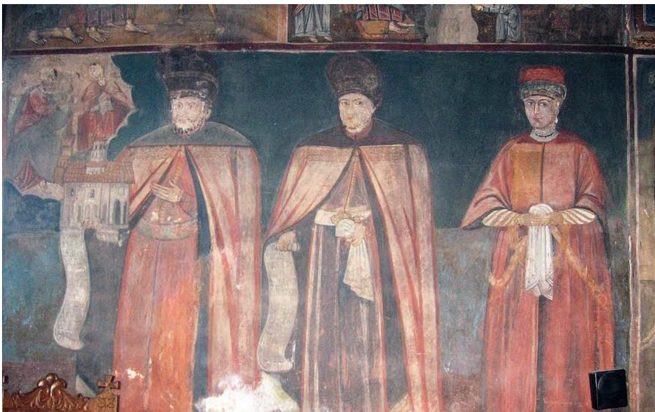
Рис. 3. Екатерина, Василий Лупу и их сын Штефэнул. Церковь Госпожи (часовня) в резиденции Господарского Дворца. Яссы, Румыния.

католических миссионеров и др. В стихотворном посвящении Атанасия Пателлару Василию Лупу (март 1643), называются 2 сына – Штефан и Иоан [27, р. 32]. Двое сыновей упоминаются на свадьбе Марии Лупу и Януша Радзивилла 5 февраля 1645 [22, р. 196-198; 42, р. 115-121]. Марко Бандини в 1647, также пишет о сыновьях Василия Лупу и Екатерины и даже указывает возраст двух мальчиков – семи и пяти лет [3, р. 337-338]. Вторым сыном Иоан, названный, по-видимому, в память о первом усопшем сыне Василия Лупу, фигурирует в пожалованной грамоте от 4/14 апреля 1645 после старшего брата Штефэницэ, как и полагалось в соответствующей последовательности [40, р. 1]. Последний раз упоминается Иоан в жалованной грамоте от 31 марта /10 апреля 1648, после Штефэницэ. Примечательно, что в этом документе упоминается и младший сын Александр, после двух старших братьев [29, р. 126-127]. Возможно, третий сын – Александр родился на рубеже 1647/1648 году или в 1648 году. Умерли двое младших сыновей в один год – 1648. Причины их смерти неизвестны.