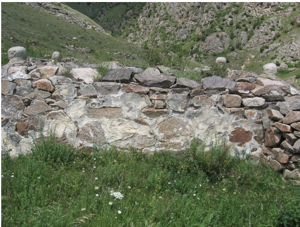
Фото № 17. Ограждение с угловыми украшениями. С. Коспарты КБР. 2008 г.

Важно отметить, что кроме надмогильных склепов на Верхнечегемском некрополе обнаружены множественные развалины капитальных оградений без крыши с декоративными элементами шарообразной формы по углам.