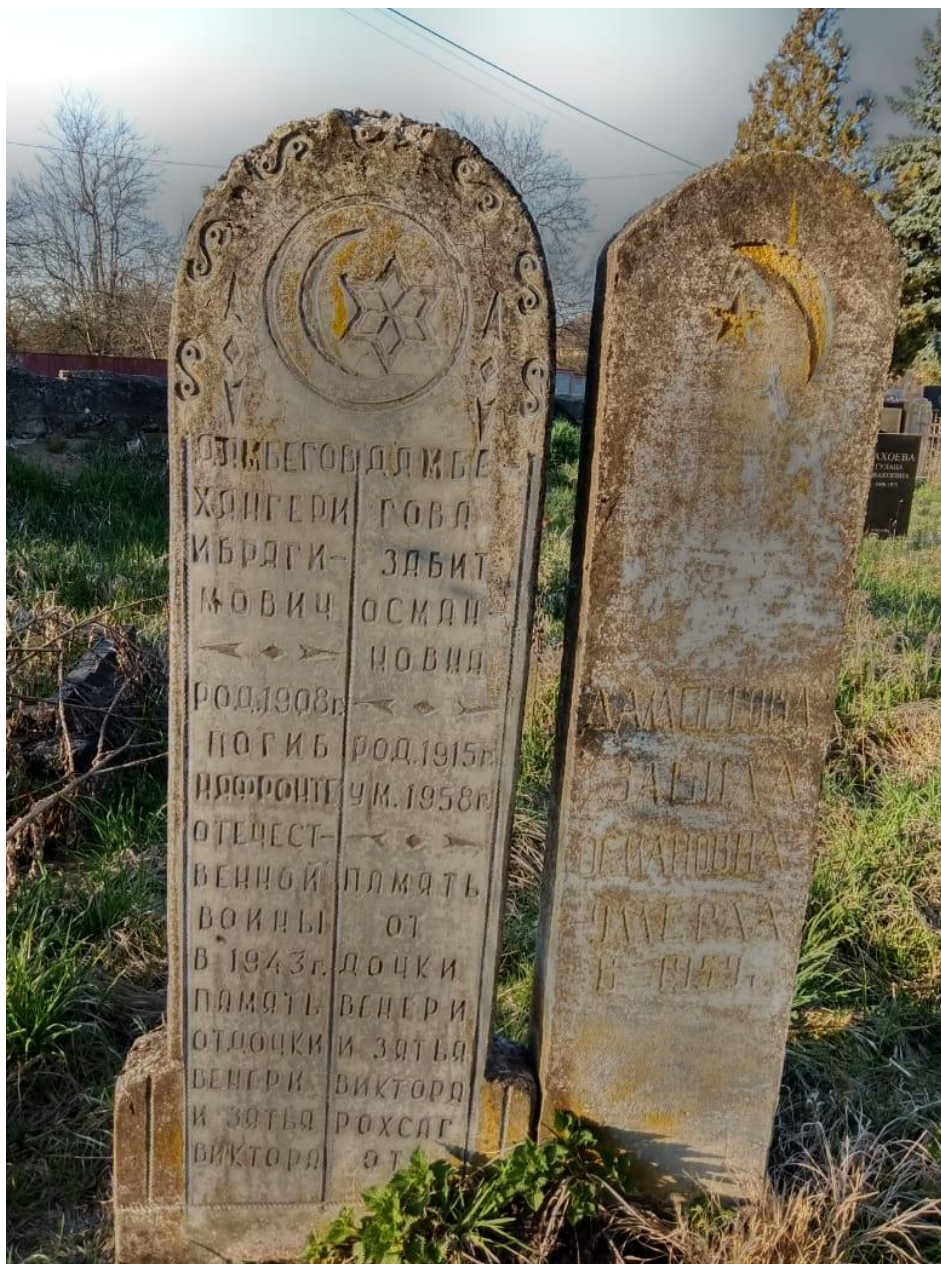
Фото № 11. Надгробия традиционной формы середины XX века. С. Чикола. Март, 2019 г.

Наиболее распространенная на этом кладбище форма надгробных памятников – цырт – арочная стела, характерная для всех народов Центрального Кавказа.