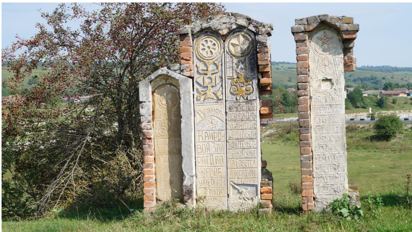
Фото № 14. Группа кенотафов у с. Лескен I РСО-Алания. Март, 2019 г.

В отличие от них осетинские кенотафы часто расположены на семейных участках, прислонены к надгробиям близких (братьев, сестер, родителей, супругов), поэтому над могилой получается парное надгробие – реальное захоронение рядом с памятником трагически погибшему члену семьи. С середины прошлого века кенотаф может замещаться фотографией, дополняющей памятник умершего родственника. Вариант с придорожными кенотафами хорошо иллюстрируется памятным некрополем на перекрестке за селением Лескен I (осетинский).