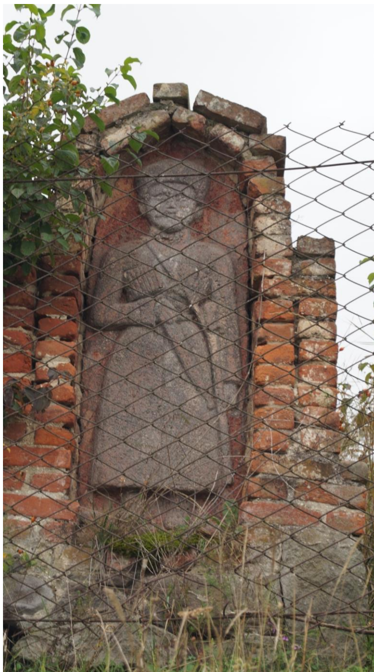
Фото № 13. Памятник работы С. Едзиева. 1-ая половина XX в. С. Карман-Синдзикау РСО-Алания. Март, 2019 г.

Значительно чаще таким дополнительным обрамлением оформлялись монументы в селении Карман-Синдзикау. Однако внутреннее наполнение многих памятников в этом и соседних селениях модернизировано. Новый вектор развития осетинской надгробной архитектуры связан с именем скульптора-примитивиста Сосланбека Едзиева (1865 – 1953). Его работы – это рельефные изображения покойных, обычно в полный рост и в национальной одежде. Памятники эти кажутся однотипными, но отличаются индивидуальной атрибутикой, характеризующей личность или область деятельности своего персонажа: кинжал, коса, лошадь и т.д.