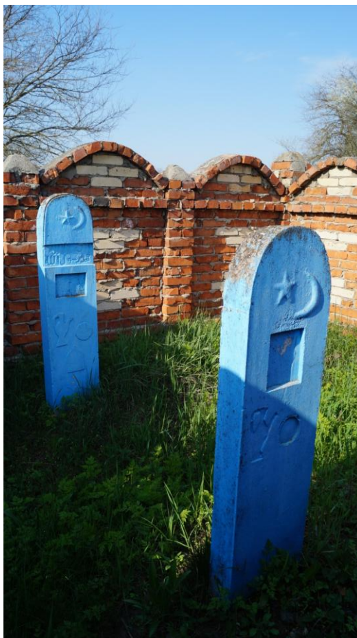
Фото № 1 1 . Вид ограждения изнутри на кладбище с. Урух КБР. Апрель, 2018 г.