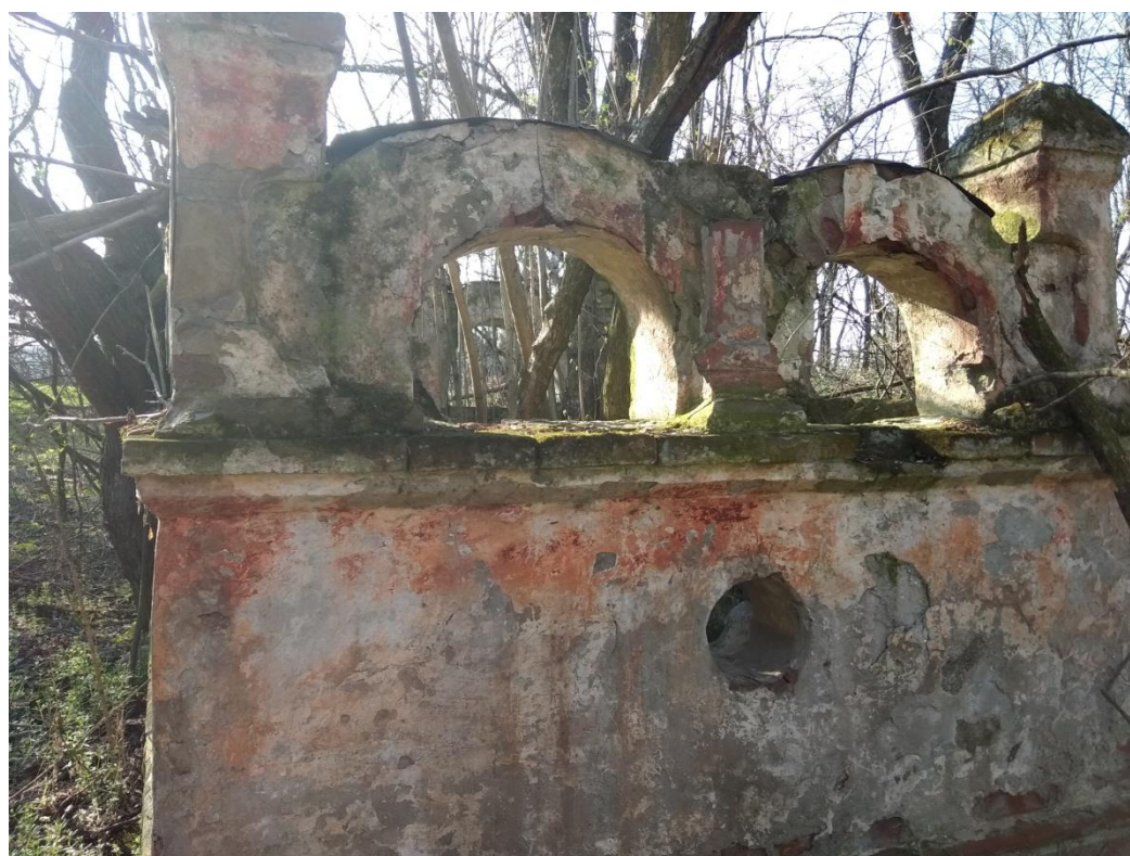
Фото № 7.