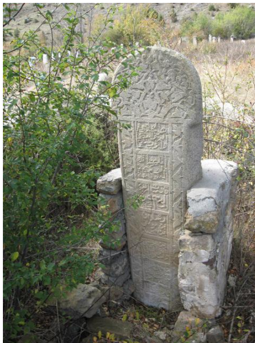
Фото № 20. Надгробие в каменном обрамлении. С. Кара-Джурт КЧР. 2008 г.

Другую аналогию с осетинскими памятниками (см. Фото № 12) мы обнаружили в фотоматериалах из Карачая, где надмогильная стела заключена в каменное обрамление.