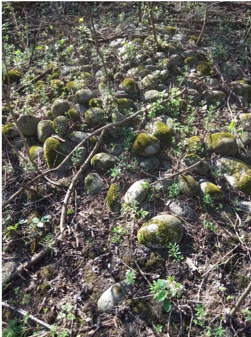
Фото № 5. Овальная выкладка могилы булыжником на старой части кладбища с. Средний Урух Ирафского района РСО-Алания. Март, 2019 г.

Урух. На окраине села находится кладбище, последние захоронения на нем датированы 2008 годом. Старая его часть, судя по словам жителей, относится к середине XIX в. Она сильно заросла деревьями, надгробные стелы глубоко вросли в землю или повалены. На многих старых могилах угадывается овальная каменная выкладка.