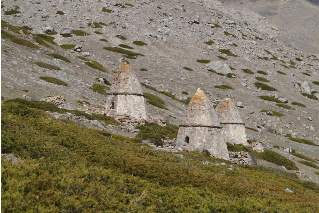
Фото № 16. Кешене с оградой. С. Верхний Чегем, КБР. Апрель, 2019 г.

Важно отметить, что кроме надмогильных склепов на Верхнечегемском некрополе обнаружены множественные развалины капитальных оградений без крыши с декоративными элементами шарообразной формы по углам.