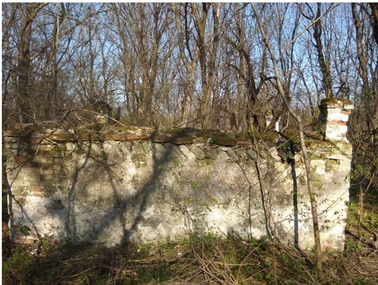
Фото № 6.