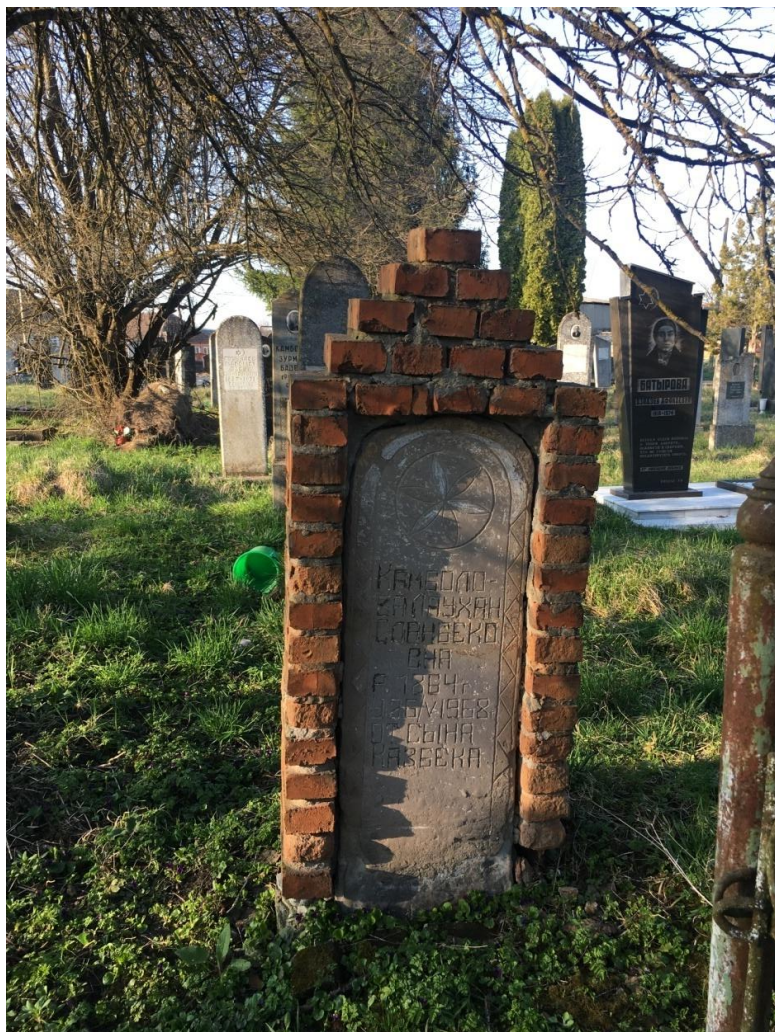
Фото № 12. Стела в кирпичном обрамлении. С. Чикола. Март, 2019 г.

В оформлении некоторых осетинских памятников цырт можно отметить еще одну особенность – кирпичное обрамление стелы. Оно почти вдвое шире бокового ребра самого надгробия. Навершие такой «защиты» может быть по форме зубчатым или заостренным в виде крыши.