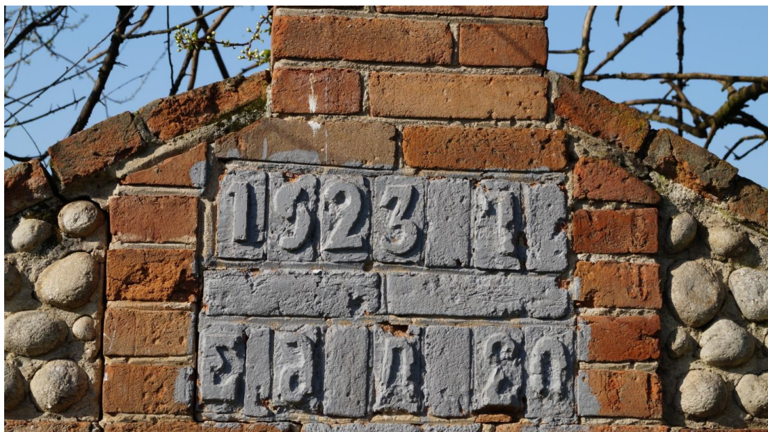
Фото № 2. Фрагмент фронтона ограждения с указанием даты сооружения в с. Урух. Апрель, 2018 г.