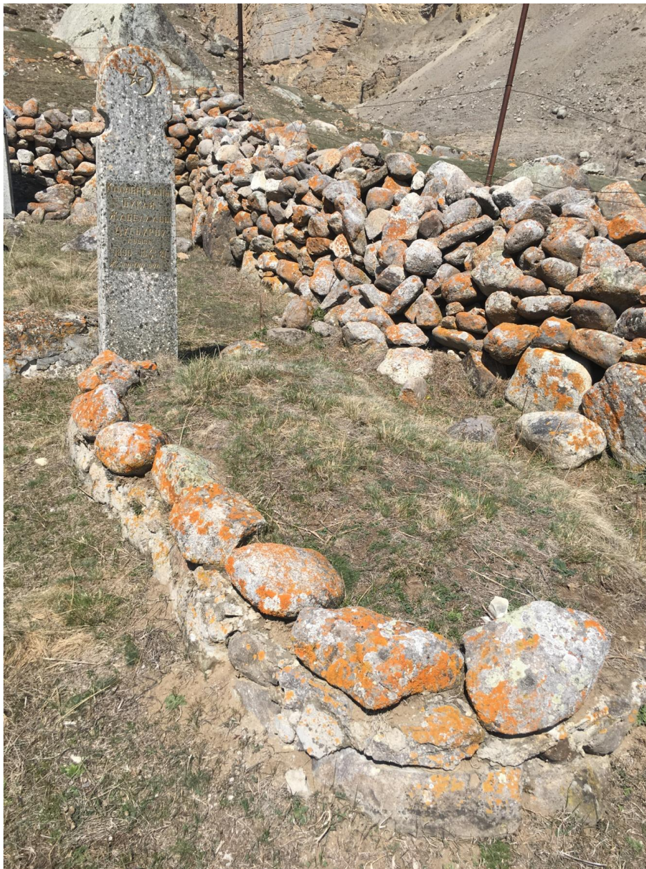
Фото № 18. Фрагмент ограды фамильного кладбища Геграевых. С. Верхний Чегем. Апрель, 2019 г.

Подобные стены встречаются на всех довоенных кладбищах Чегемского ущелья. Они строятся вокруг фамильных отводов, как например у Геграевых.