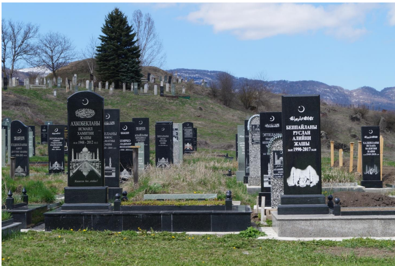
Фото № 21. Современные мусульманские надгробия. С. Нижний Чегем, КБР.

зависимости от материального достатка семьи, часто прямоугольной формы, мрамор и гранит вытесняют традиционные материалы. Популярным оформлением надгробия всю вторую половину XX в. была фотография покойного. С конца 1990-х годов, времени ослабления коммунистической монополии на идеологию, на памятниках акцентируется мусульманская символика, например, аяты из Корана, изображение мечети, полумесяца. Правда, в понимании местного населения сформировались устойчивые предпочтения в изображении мечети (индийский Тадж-Махал, а, например, не аль-Харам в Мекке и Мечеть Пророка в Медине).