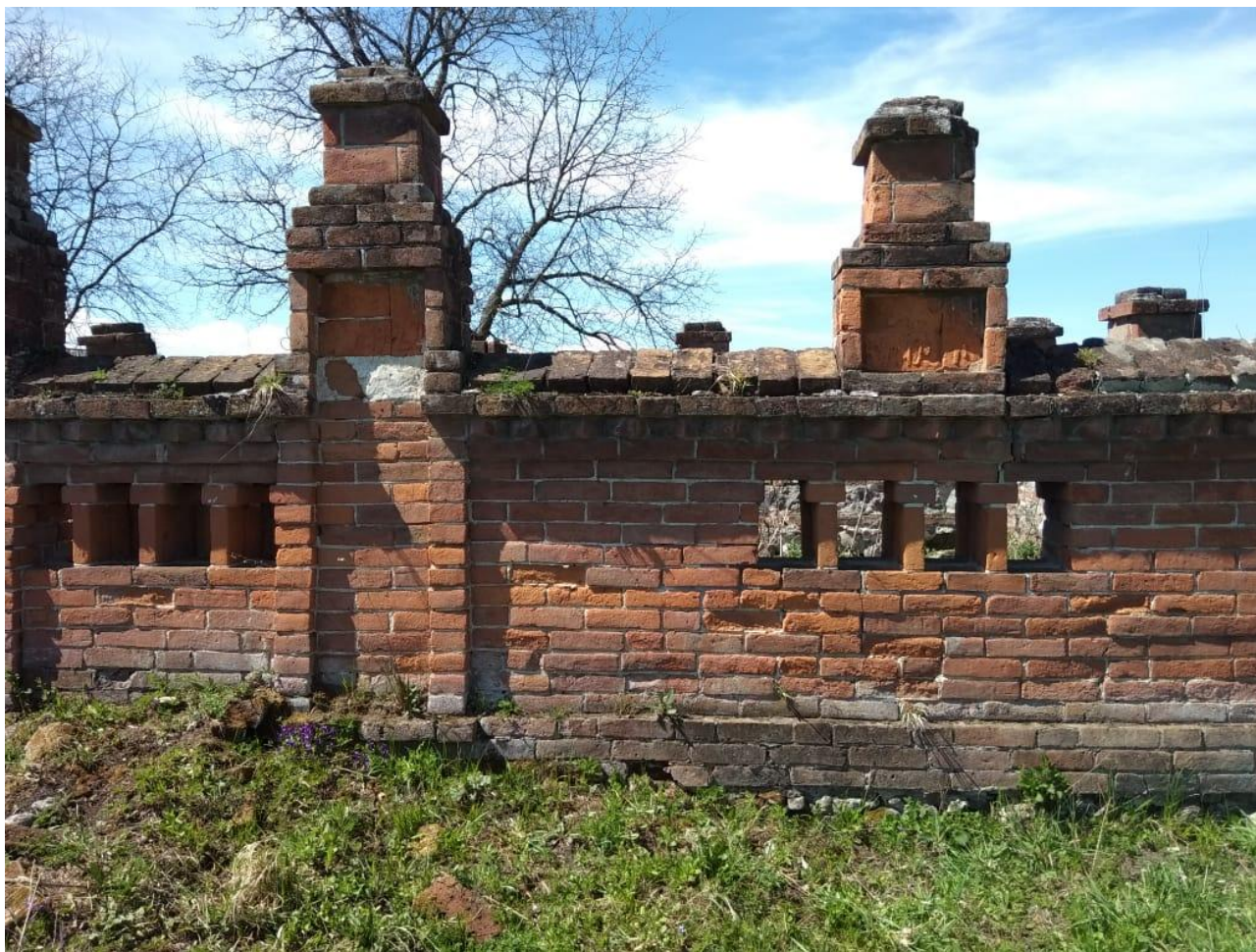
Фото № 9. Ограждение семейного захоронения на кладбище с. Толдзгун Ирафского района РСО-Алания. Март, 2019 г.

В селении Толдзгун хорошо сохранилась «склеповая» ограда семейного захоронения, датируемого 1919-1930 годами. Все могилы отмечены возвышающимися памятными стелами, встроенными в замкнутый архитектурный ансамбль ограждения. Они выступают над стеной и содержат эпитафическую надпись, обращенную не к могиле, а вовне. Такая ориентация объясняется тем, что «мавзолей» не имеет входа.