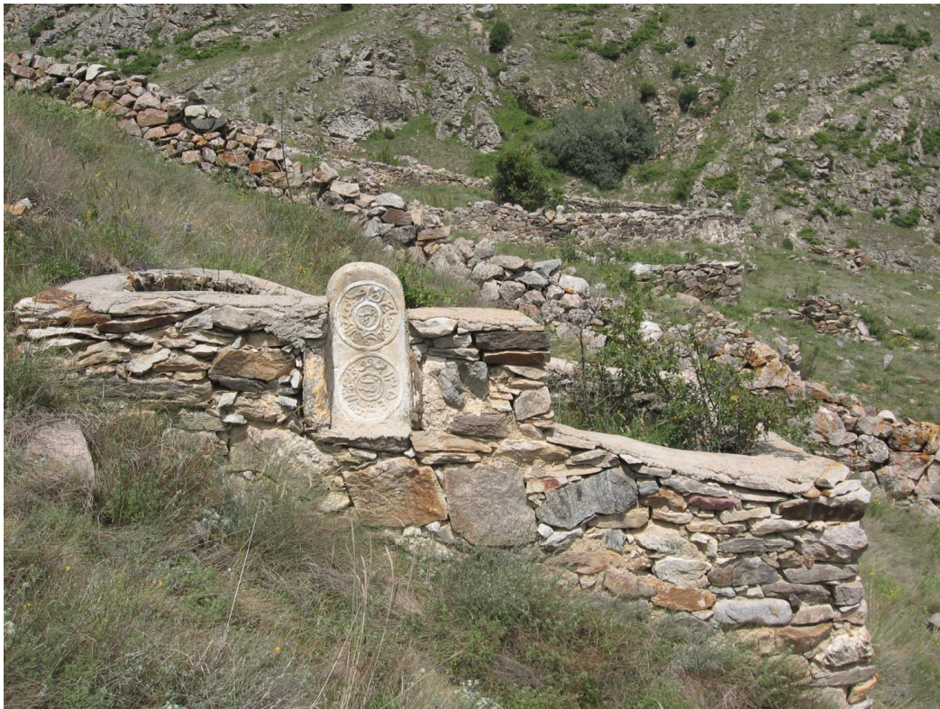
Фото № 19. Стела, встроенная в ограду фамильного захоронения. С. Коспарты КБР. 2008 г.

Другую аналогию с осетинскими памятниками (см. Фото № 12) мы обнаружили в фотоматериалах из Карачая, где надмогильная стела заключена в каменное обрамление.