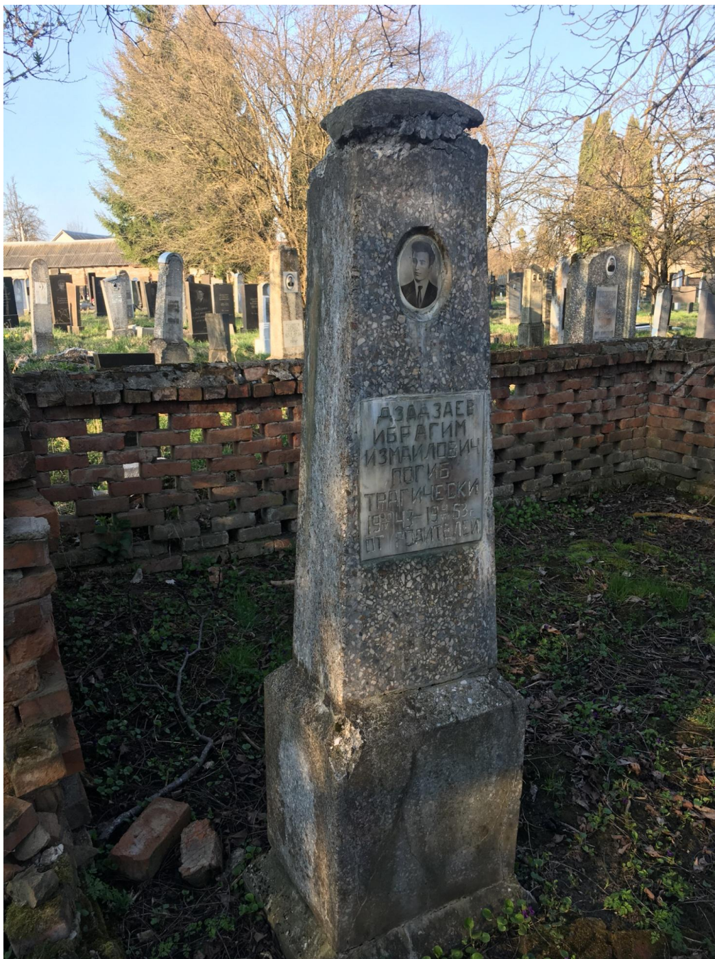
Фото №10. Ограда захоронения. С. Чикола Ирафского района РСО-Алания. Март, 2019 г.

Чикола (бывшее с. Магометановское). Углубление в старую часть кладбища дает тот же этнографический материал – «склеповые» ограждения из булыжника и красного кирпича. Приблизительно к середине XX века ограды становятся ниже, принимают более легкую, решетчатую форму и освобождаются от избыточных декоративных деталей, отказываются от камня в пользу кирпича, стены становятся ниже. Постепенно они заменяются кованными легкими ограждениями.