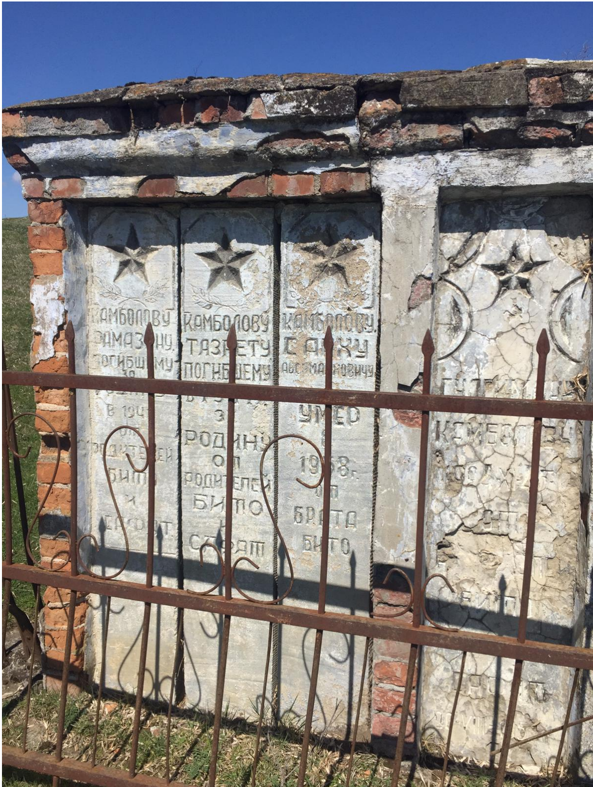
Фото № 15. Группа кенотафов у с. Хазнидон. Март, 2019 г.

Менее крупные композиции вынесены также за пределы того же Лескена и Хазнидона.