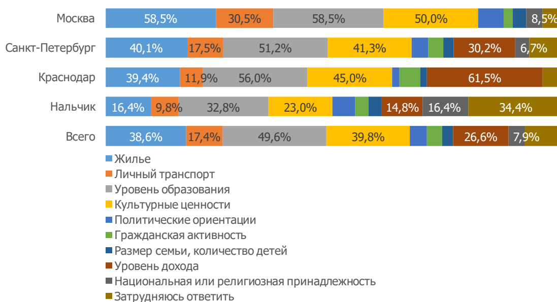
Рисунок 2. Распределение ответов на вопрос «По каким из следующих критериев Вы можете с уверенностью судить о том, принадлежит ли тот или иной человек к ОДНОМУ с Вами социальному классу?»

Среди признаков, по которым респонденты могут с уверенностью судить о том, принадлежит ли тот или иной человек к одному с ними социальному классу на первое место вышел нематериальный критерий «уровень образования». Далее следуют «культурные ценности» и «жилье». Так для респондентов из Москвы нематериальные и материальные признаки равноценны среди критериев принадлежности к социальному классу (рис. 2).