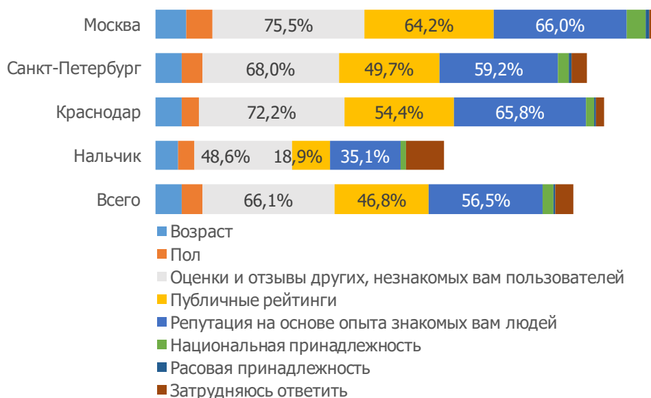
Рисунок 1. Распределение ответов на вопрос «Что из перечисленного является для Вас важным и определяет выбор пользователей или поставщиков товаров и услуг при использовании сервисами совместного потребления?»

В выборе факторов, определяющих предпочтения респондентов в выборе поставщиков товаров и услуг, приоритет на стороне факторов информационно-цифрового характера в сравнении с традиционными, такими как возраст, пол или национальная принадлежность, но. В Москве, Санкт-Петербурге и Краснодаре наибольшее значение с примерно равным соотношением имеют такие критерии, как «оценки и отзывы других, незнакомых вам пользователей», «публичные рейтинги» и «репутация на основе опыта знакомых людей». В Нальчике наибольшее значение для выбора имеют факторы «оценки и отзывы других, незнакомых вам пользователей» и «репутация на основе опыта знакомых людей» (рис. 1).