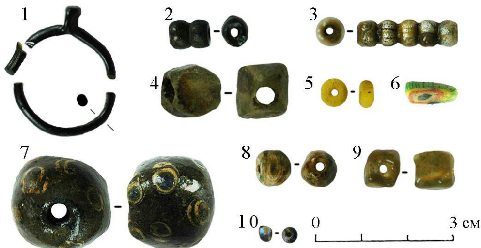
Рисунок 3. Могильник Гоуст. Погребение 5. Изделия из стекла. 1 – стеклянный перстень, 2 – 11 – бусы.

Бисер из синего непрозрачного стекла. Размеры 0,3 x 0,34 см (Рис. 3: 10).