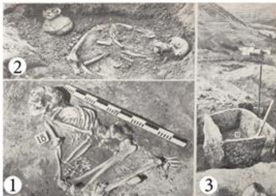
Рис. 3. Подкурганые погребения: 1 и 2 – грунтовые; 3 – каменный ящик [Чеченов 1969: 38].