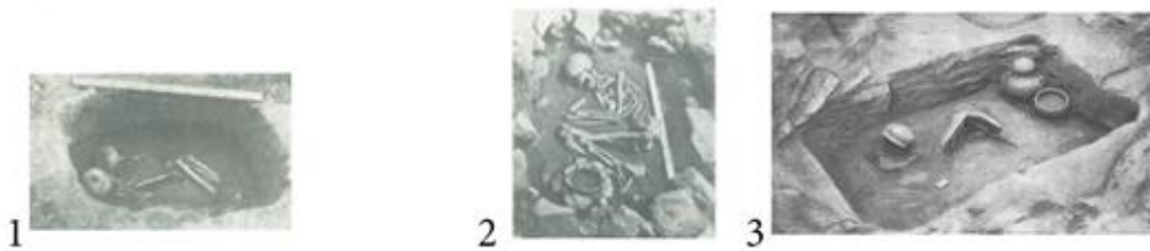
Рис. 1. Грунтовые ямы [Гриневич 1949: 134].