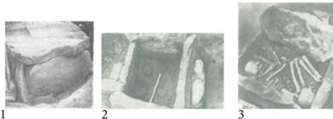
Рис. 2. Каменные ящики [Гриневич 1949: 129].