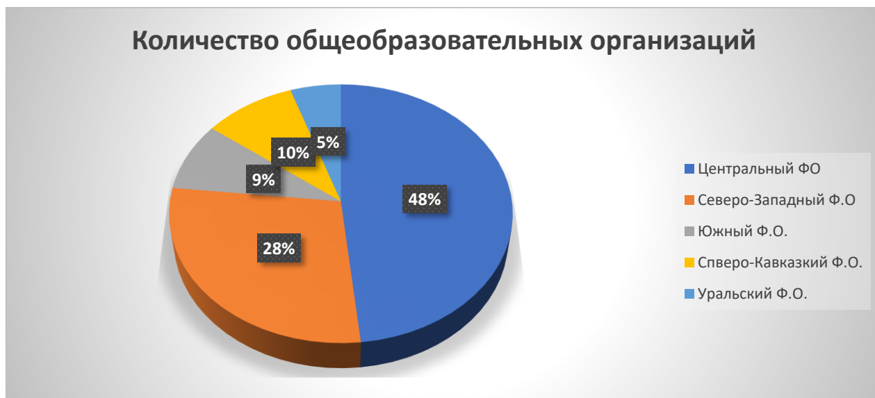
Диаграмма 1. Количество общеобразовательных организаций, распределенных по регионам РФ.

Количество общеобразовательных организаций в регионах РФ, представлено на Диаграмме 1.