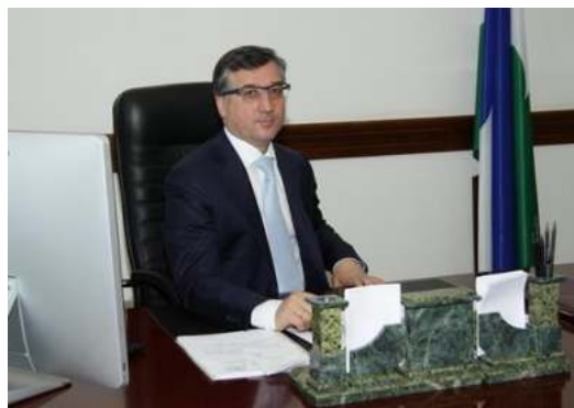
Алий Мусуков - Председатель правительства КБР, 1993 г.в.