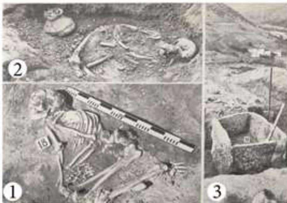
Рис. 3. Подкурганые погребения: 1 и 2 – грунтовые; 3 – каменный ящик [Чеченов 1969: 38].