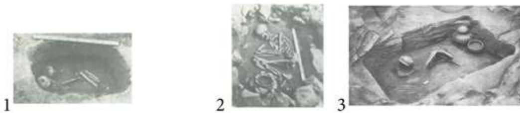
Рис. 1. Грунтовые ямы [Гриневич 1949: 134].