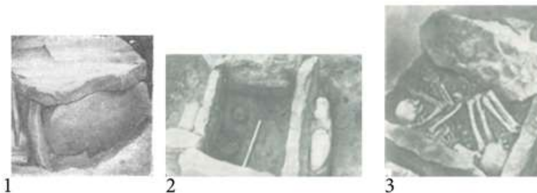
Рис. 2. Каменные ящики [Гриневич 1949: 129].